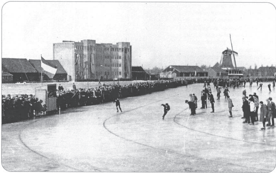
In nummer 133 (december 2005) van De Windbrief, een uitgave van de vereniging De Zaanse Molen, stond een foto van de fabriek van Kan met rechts daarvan de molen De Koperslager. De foto is genomen vanaf de Zaan, waar toen een ijsbaan was afgezet. Het zal in 1929 geweest zijn. Ik weet dat de Zaan in dat jaar bevroren was en ik ben met mijn vader naar schaatswedstrijden op de Zaan wezen kijken. In 1932 is de fabriek uitgebrand. De Koperslager is in 1964 verbrand.

stoffen en de afvoer van eindproducten goed kon gebeuren.