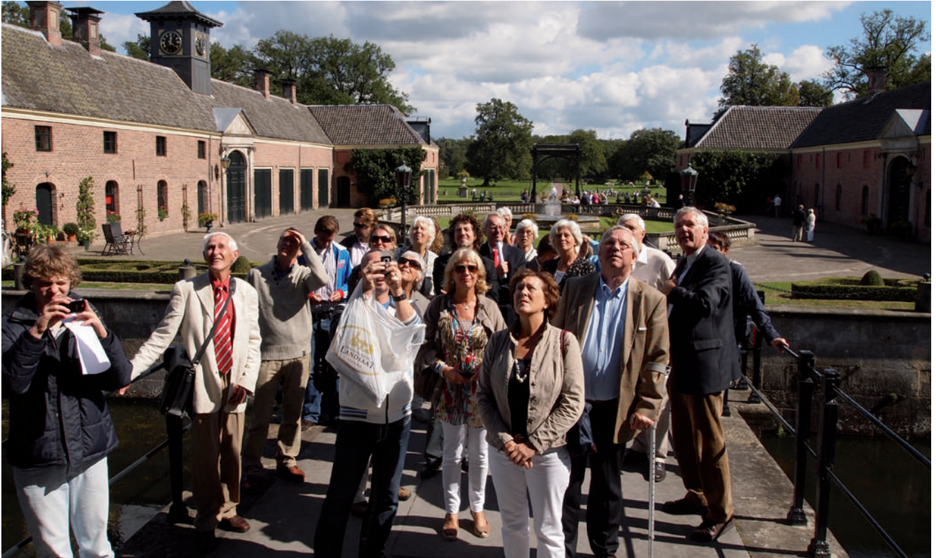
De Reunie te Delden op 3 september 2010

MEDEDELINGEN VAN DE STICHTING FAMILIE VIS VAN ZAANDIJK