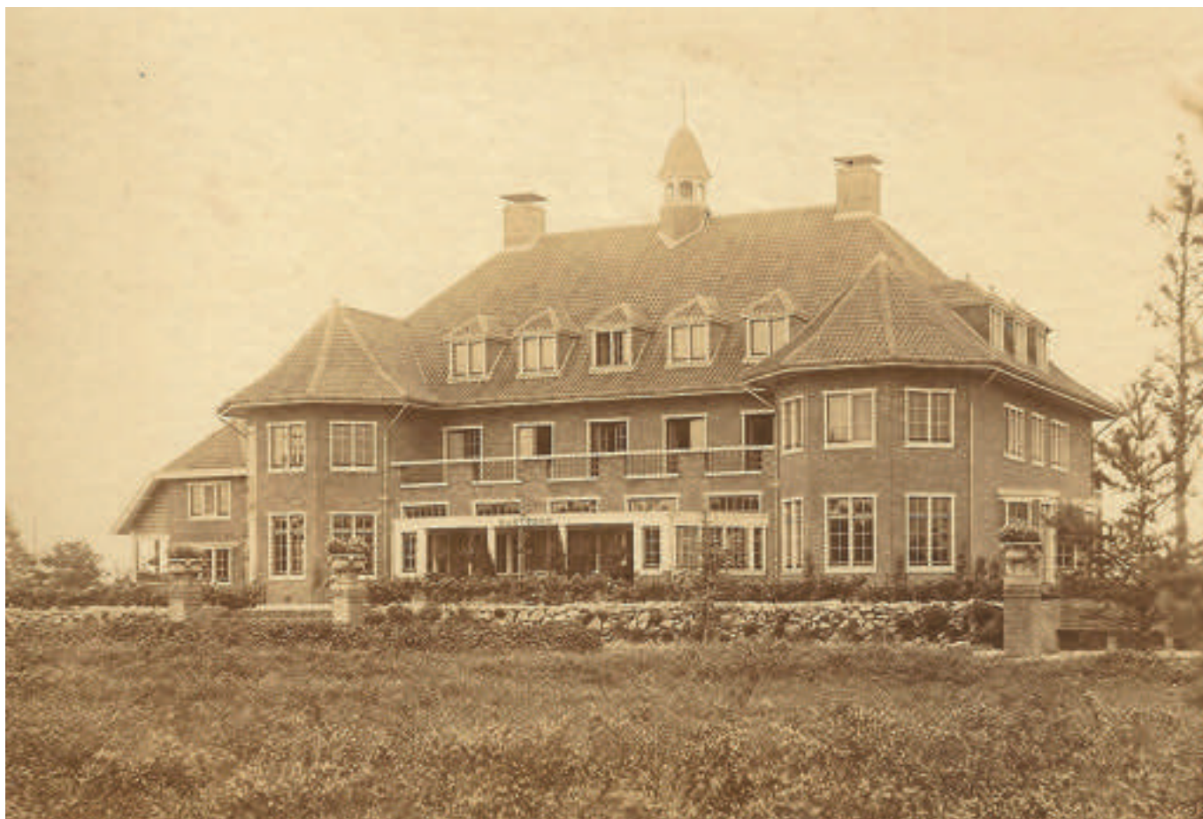
Het kapitale landhuis Rustoord op landgoed "De Utrecht"

Maatschappij Utrecht een feit. Alle polissen van "Let op uw Einde" worden overgeschreven naar de nieuwe, moderne levensverzekerings-maatschappij. In 1899 heeft de al maar uitdijende onderneming behoefte aan een groot en vooral efficiënt hoofdkantoor. Architect Jan Verheul Dzn tekent een imposant gebouw in Art Nouveau-stijl, dat in 1902 wordt opgeleverd aan de Utrechtse Leidseweg, vlak bij het centraal station.