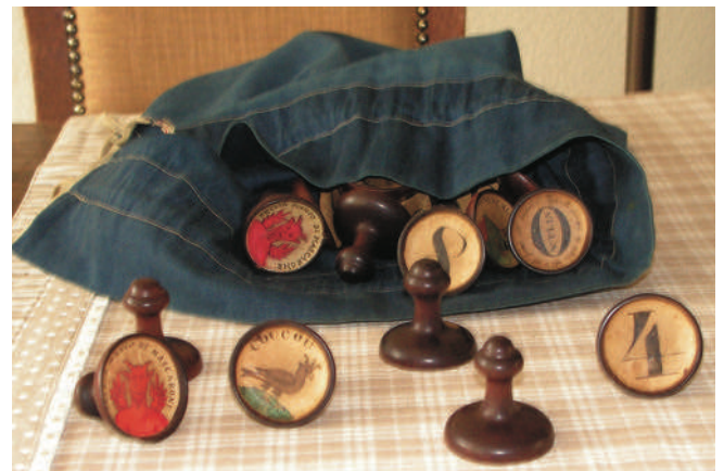
Foto van de zak met enkele doppen eruit

Het spel bestaat uit 38 doppen (twee van elk) met een bepaalde waarde. Een dop was gemaakt van mahoniehout, met een steel, waaronder een ronde schijf, waar aan de onderkant een afbeelding of cijfer is geplakt. De doppen zitten in een katoenen zak die door de eerst aangewezen deelnemer uit de zak worden uitgedeeld, te beginnen met zijn linker buurman en zo verder met de klok mee, totdat hij een dop voor zichzelf uit de zak haalt. De zak wordt