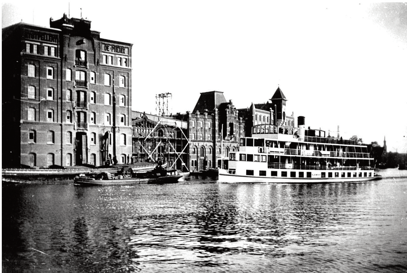
Salonboot Alkmaar vaart voorbij de rijspellerij "de Phoenix" in Zaandam

tram "Bello" naar Bergen en Schoorl trokken. Een dagretour in de 1 e klasse kostte één gulden, de 2 e klasse 65 cent. Ook tijdens de Zaandammer kermis werden goede zaken gedaan. Mijn herinneringen zijn van na de Tweede Wereld Oorlog. Toen ging het al bergafwaarts. Onderweg meerden de boten af bij Akersloot, Knollendam, Wormerveer-Noord, Wormerveer-Zuid, Zaandam en Vissershop. Eerder werden ook nog Zaandijk en Koog aan de Zaan aangedaan, maar zelf weet ik hier niet van. Het was "De Stierop" die de laatste jaren de verbinding tussen Alkmaar en Amsterdam onderhield. Ook "De Alkmaar" was vaak