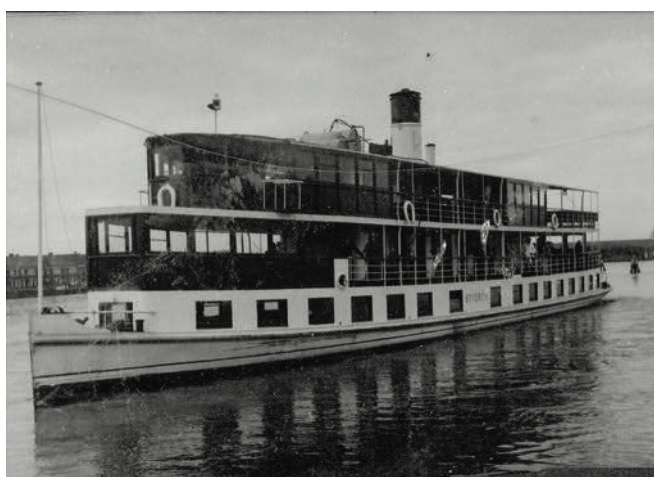
Salonboot de "Stierop"