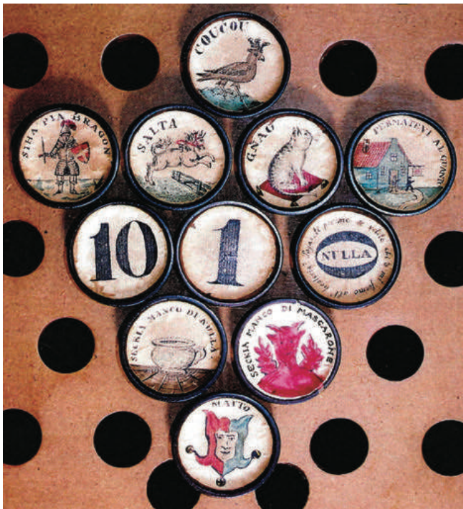
Coucou (Koekoek) Siha Pia Bragon (Gewapende Man), Salta (Paard), Gnau (Kat), Fermatevi al Quanto (Herberg) 10, 9, 8, 7, 6, 5, 4, 3, 2, 1, Nulla Seckia Manco di Nulla (Potje), Seckia Manco di Mascarone (Duivel) Matto (Zot of Gek)

Eén van de attracties was dat er geldprijzen mee gewonnen kon worden: 1 e prijs een zilverden rijksdaalder, tweede prijs een zilveren gulden, daarna een kwartje, een dubbeltje, een stuiver en een cent. Vanaf een jaar of zeven, als je tot na twaalf uur mocht opblijven, mocht je meedoen, want het was een spel voor jong en oud. Vooral mijn moeder vond het heerlijk en ze leerde haar zoons al vroeg de spelregels. Het was geen moeilijk spel, maar je moest de regels wel kennen. In de kamer werd een grote kring gemaakt en iedereen kreeg drie tot zes benen, afhankelijk van de hoeveelheid personen. Een “been” is een fiche, vroeger gemaakt van een stukje bot (vgl. “botje bij botje leggen”). Bij ons waren dat mooi bewerkte schijfjes van parelmoer uit de spellenkist van opa Boekenoogen.