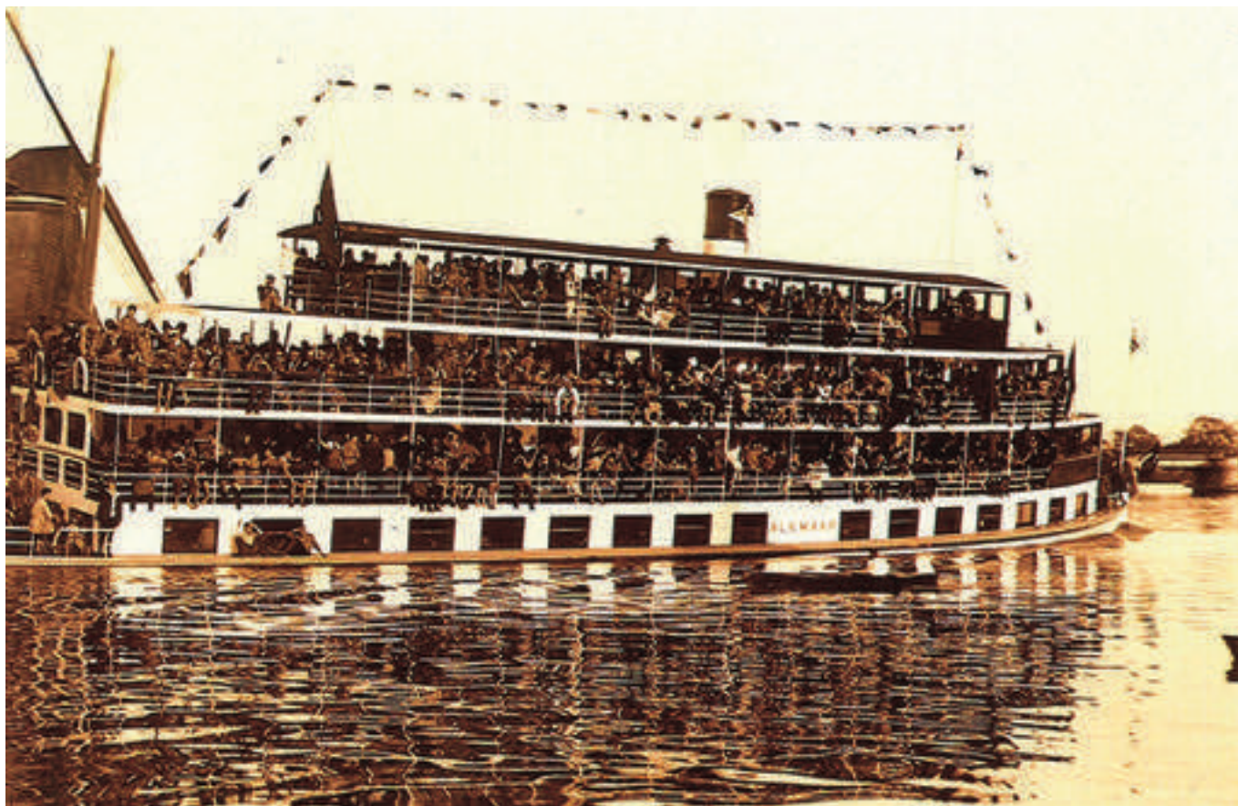
Salonboot de "Alkmaar", het vlaggenschip van de Alkmaar Packet in 1925 vaart voorbij molen de Jonker in Zaandam

Een echte snelle verbinding was de bootdienst niet. De reis van Alkmaar naar Amsterdam duurde ruim twee en een half uur. In de zomermaanden waren de schepen vaak afgeladen vol met dagjesmensen, die van Amsterdam en Zaandam naar Alkmaar voeren en vandaar met de stoom-