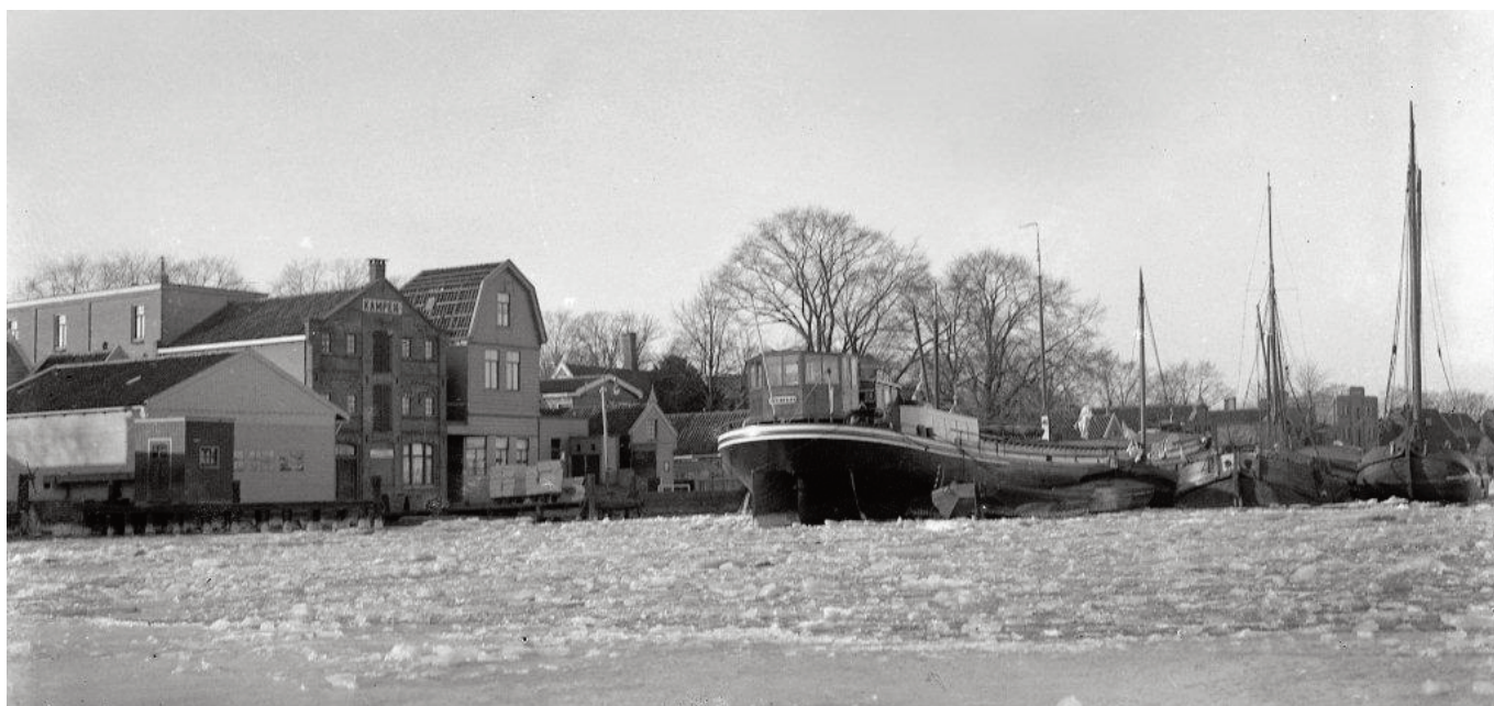
Kaaspakhuis Kampen met rechts het woonhuis van Gerbrand Vis (I) ten noorden van de sluis.

der. Van alle omgekomen militairen in de 1 e WO, overleed 70 procent aan de Spaanse Griep. En toen de overlevenden huiswaarts keerden, reisde het virus met ze mee. Het noodlot sloeg als eerste toe in het, evenals Nederland, neutrale Spanje. Waar zelfs Koning Alonso er bijna aan bezweek. Niet (meer) gehinderd door oorlog censuur, verschenen er alarmerende berichten in de kranten. Na hevige koortsaanvallen te hebben overwonnen (die leken op griep, vandaar de naam) wist hij, volgens de schrijvende pers, te herstellen door het achteroverslaan van een hele fles Bacardi rum. De eerste golf van de Spaanse griep bereikte Nederland in het voorjaar van 1918. In het Noorden via het Engelse interneringskamp in Groningen en in het Zuiden via de grensplaats Retranchement in Zeeuws-