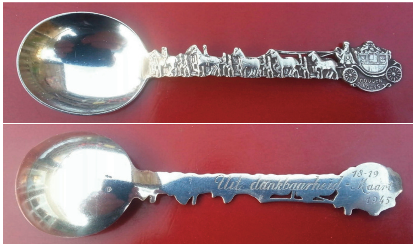
Zilveren lepel met een afbeelding van de Gouden Koets. Opschrift: Uit dankbaarheid = 18-19 Maart 1945