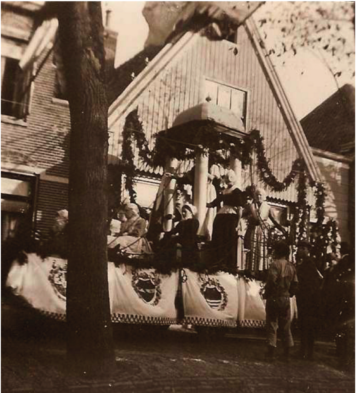
Onafhankelijkheidsfeest 1813-1913 op de Lagedijk in Zandijk in 1913

vinding heeft geleerd, dat deze verlichting a giorno in onze gemeente met zijne bochten en hoeken een schoonen en schilderachtigen aanblik kan opleveren’.