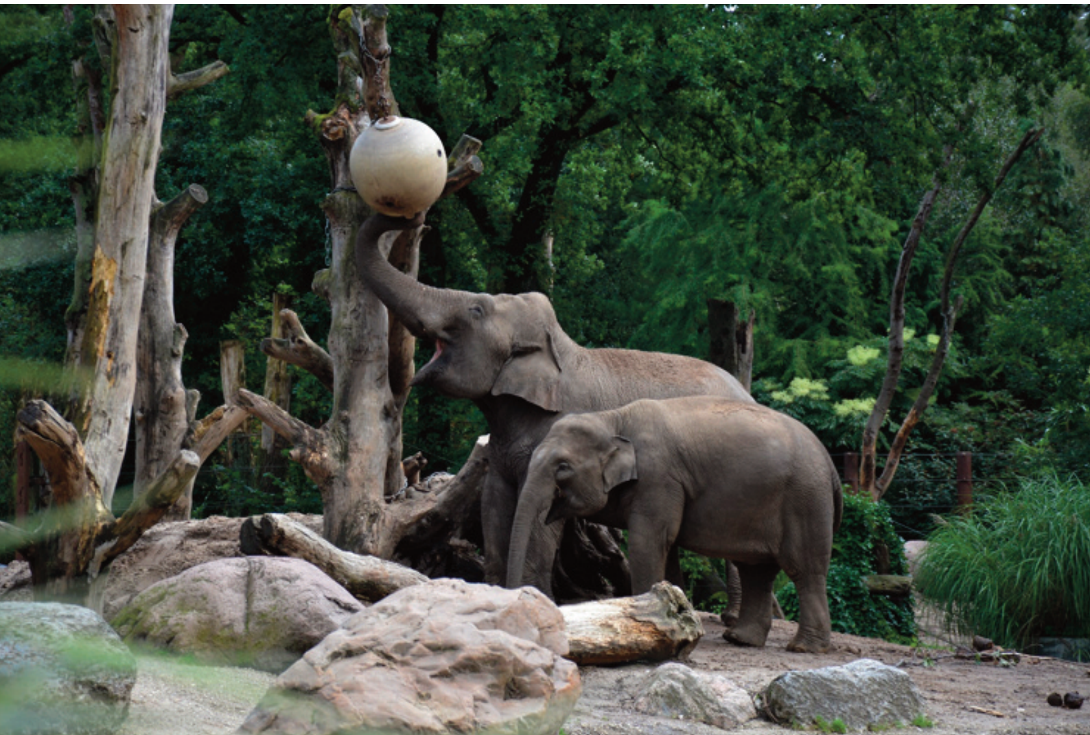
Spelende olifanten in De Savanne

gulden. In 1959 kwamen de eerste olifanten, die allerlei kunsten werden geleerd. Er werd geld verdiend met winkelverkoop: de dieren mochten toen nog worden gevoerd en er werden veel zakjes met pinda's verkocht. Horeca activiteiten droegen goed bij aan de inkomsten. Zo is het park van de grond af aan opgebouwd tot de huidige uitgebreide dierentuin. Het is echter nooit af. In 1988 kwam er een groot stuk terrein bij. Nieuw is de grote vogelvolière en het Dino Avonturenpark. Op steeds natuurlijkere wijze kunnen de dieren worden bekeken. Het park verandert voortdurend en volgt nieuwe ontwikkelingen. De dieren komen bijvoorbeeld niet meer uit het wild en tegenwoordig zijn alle dieren hier of in andere dierenparken geboren. Er bestaan uitgebreide fokprogramma's en uitwisselingen met andere diergaardes. Er zijn nu 100 mensen in vaste dienst, voor de verzorging, horeca, kantoor, veiligheid en technische dienst en omzet loopt in de miljoenen. Fred is helemaal opgegroeid in het park, maar heeft ook daarbuiten de nodige ervaring opgedaan. Hij doet nu veel aan het opleiden van de medewerkers en vrijwilligers.