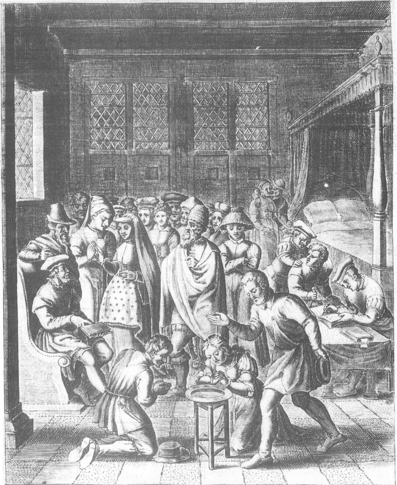
Gezelschap van Anabaptisten omstreeks 1534