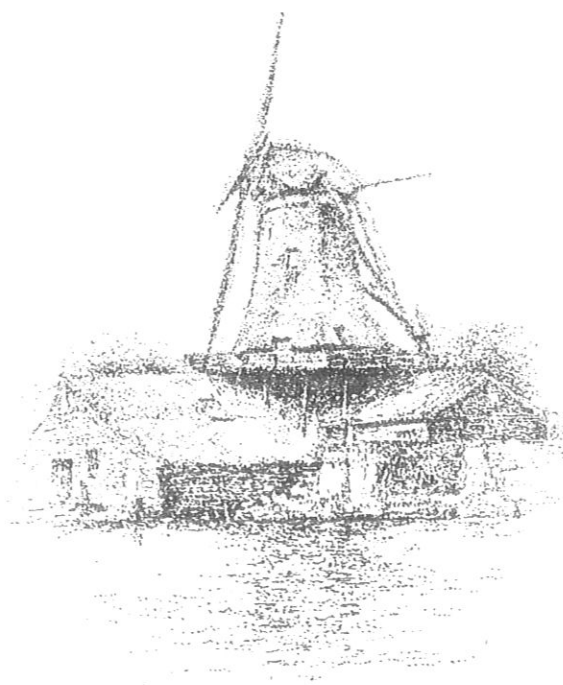
Verfmolen 'De Pauwin'