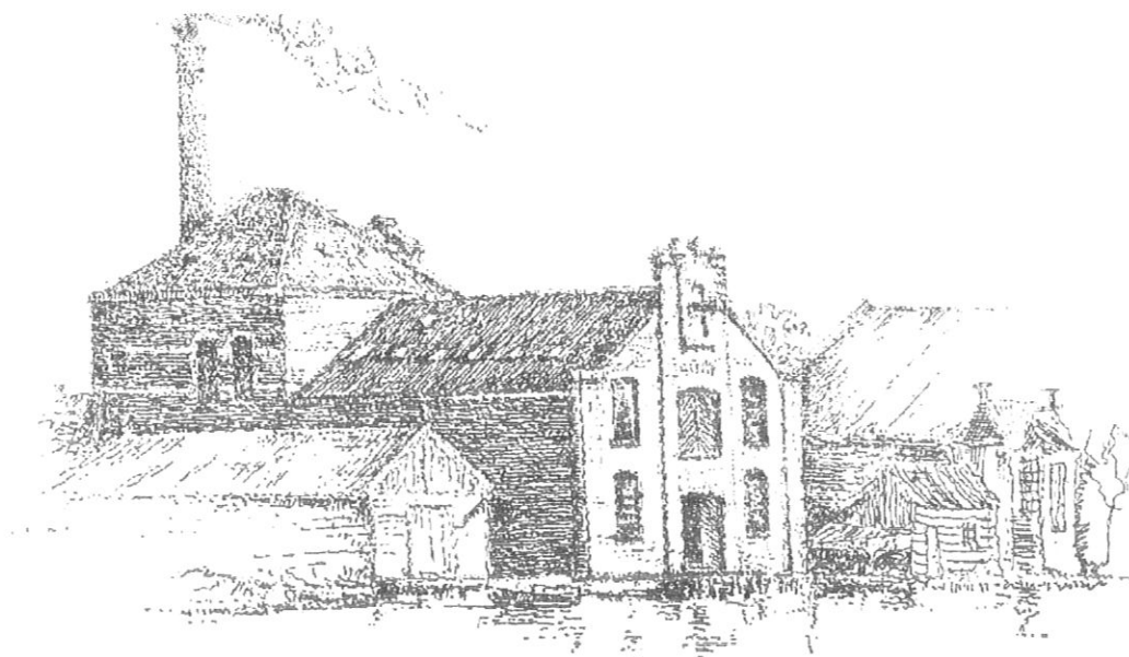
Stoomfabriek 'De Vooruitgang'