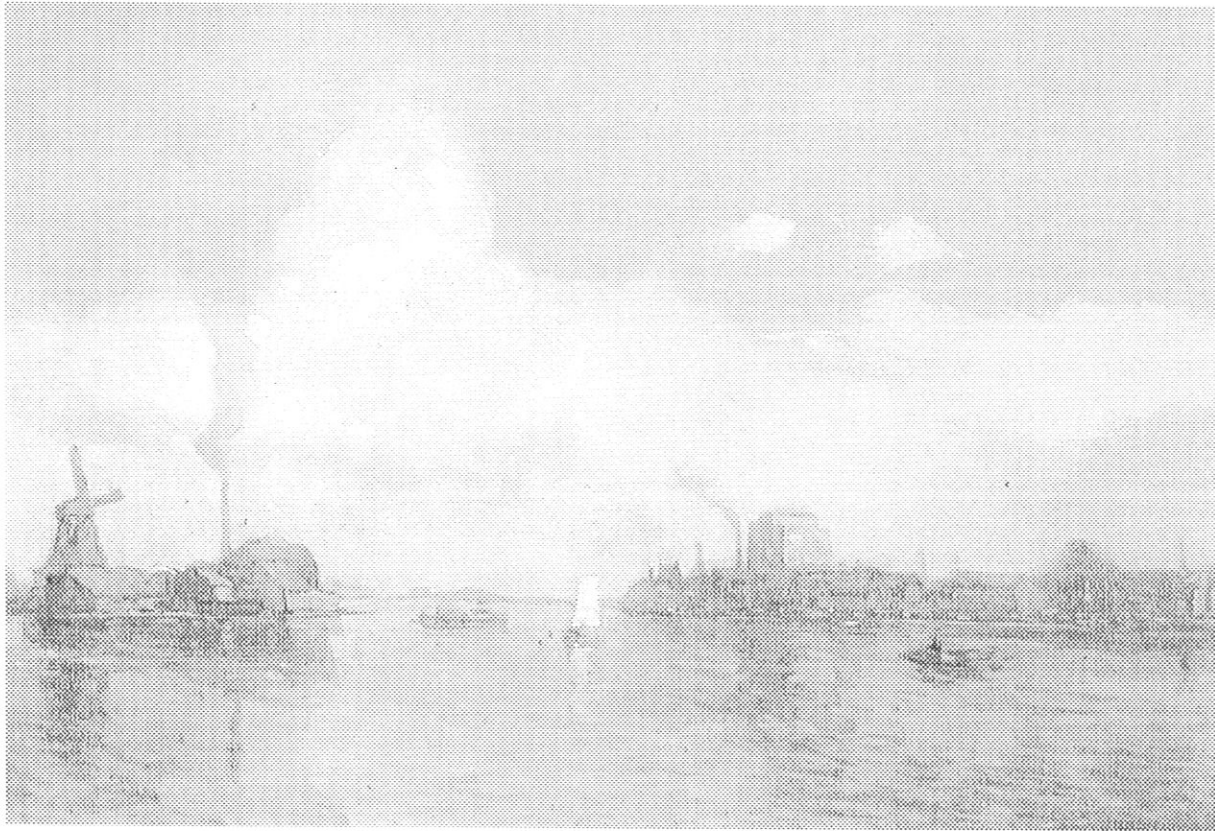
Uitzicht op de Zaan vanuit Lagedijk 56. Olieverfschilderij van Herman Heijenbrock

ijzergieterijen. De in dat industriegebied heersende werk- en levensomstandigheden maken diepe indruk op hem.