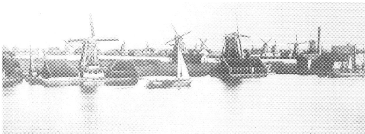
Gezicht op de oostelijke Zaanoever vanuit Zaandijk omstreeks 1900. Op de voorgrond de oliemolens De Windhond en De Ooievaar en de oliefabriek De Wachter.

In een oliemolen stond men op stukloon en daarbij werd per verwerkte last, ongeveer 2000 kg, betaald. Geen wind, geen inkomen en bij vrijwel alle molens werd in de zomer, wanneer de molenmakers het groot onderhoud verrichtten, niets uitbetaald. Het personeel werd geacht de boeren te helpen en zo wat geld te verdienen. En was er geen wind, dan moest het personeel het kleine onderhoud voor zijn rekening nemen, zonder betaling! Bij gunstige wind waren tal van molens 24 uur in bedrijf. De bemanning maakte dan dagen van 16 uur en zelfs meer. Vooral pelmolens waren in de regel dag en nacht in bedrijf als de wind dat toeliet. Bij gunstige wind was de bemanning van een pelmolen alleen zondagmorgen tot maandag-