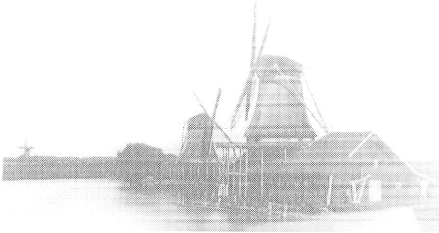
De oorspronkelijke molen De Kat in of voor 1904, met daarachter oliemolen De Wind en op de achtergrond pelmolen De Jonge Prinses.