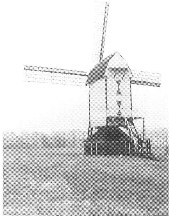
Standaardmolen in het Land van Maas en Waal.

waarvoor een jaartal van 1222 vermeld wordt. Een ander document vermeldt dat Floris V aan de burgers van Haarlem het recht op een windmolen verleende en wel in 1274. Met de windmolens kwamen typische molenaarsuitdrukkingen in onze taal en ook daar aan kan men ongeveer de komst van deze bouwsels vaststellen. Nu moet men niet denken dat het hier molens betrof zoals wij die thans op de Zaanse Schans kunnen bewonderen. Het waren zogenaamde standaardmolens, bestaande uit een zware houten kast met vier wieken, draaibaar om een zware sterk geschoorde as. Gelukkig zijn er van dit type een behoorlijk aantal bewaard gebleven. De meesten hiervan in prachtige staat. De Engelsen noemen dit type 'Pole Mills' en op een afbeelding van Nieuw-Amsterdam, het tegenwoordige New York, ziet men deze molens naast de huizen. Later heeft men de voet van de zware paal met de schoren afgedekt.