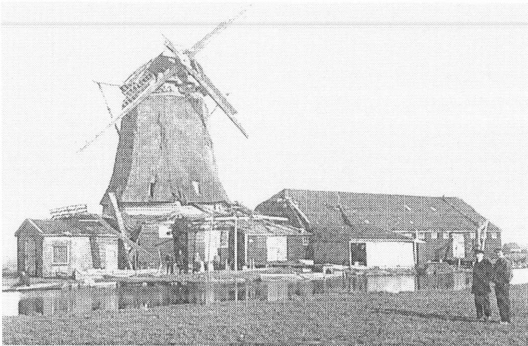
De Zoeker na de windhoos van 26 februari 1925

Het gaf tevens de stoot tot oprichting van de vereniging 'De Zaanse Molen'. In 1950 werd De Zoeker aangekocht door de gemeente Zaandijk, maar in 1954 kwam de molen weer stil te staan. Na vier jaar stilstand werd in 1958 een nieuwe exploitatievorm voor deze bijzondere molen gevonden: het 'Olieslagerscontract 1958'. Hierin participeerden een tiental Zaanse bedrijven, die zich bereid verklaarden de oliemolen permanent in bedrijf te brengen en te houden. Door de gemeente Zaandijk werd een grote restauratie bekostigd en door het contract werd de aanstelling in vaste dienst van een molenaar mogelijk. Te verwachten jaarlijkse exploitatietekorten zouden gezamenlijk worden gedragen door de bedrijven die deelnamen aan het Olieslagerscontract.