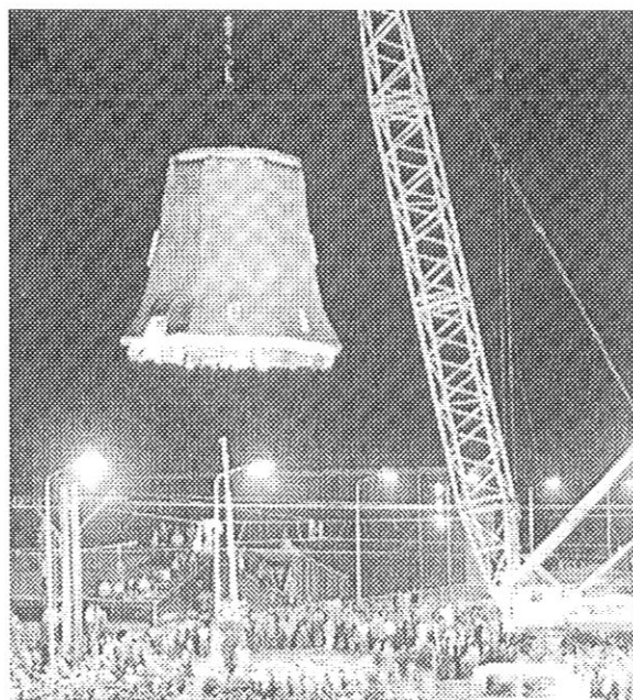
Het bovenachtkant van De Zoeker wordt over de bovenleiding van de spoorwegovergang getild in de nacht van 1 op 2 augustus 1968.