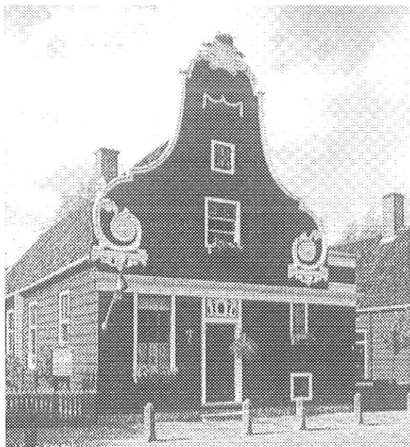
Het Uurwerkmuseum op de Zaanse Schans

H ET MUSEUM van het Nederlandse Uurwerk op de Zaanse Schans is gevestigd achter een 18e eeuwse klokgevel in Lodewijk XV-stijl, afkomstig van het Gorterspad in Zaandijk. Het museum pand zelf is een voormalig zeildoekwevershuis daterend uit de periode rond 1673. Het stond oorspronkelijk aan de dorpsstraat in Assendelft en is in 1975 verplaatst naar de Zaanse Schans, waar het in 1976 als uurwerkmuseum in gebruik werd genomen en toont een compleet overzicht van de ontwikkeling van het Nederlandse uurwerk.