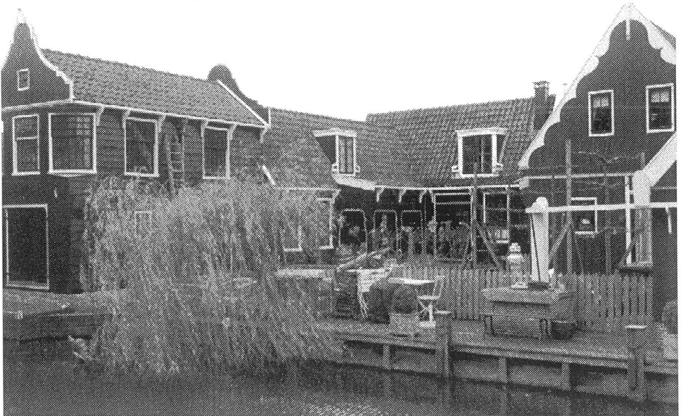
Aanbouw na aanbouw, aan het Hazepad te Zaanwijk (voorheen Westzijde Zaandam)

naam 'goedjaarsend' te gebruiken, verwees zij er wél naar. Haar boekje verscheen voor het eerst in 1912. Zo kan worden geconcludeerd dat het woord tussen 1897 en 1912 moet zijn ontstaan en gepubliceerd. Dit is dan ook het geval. In 1909 verscheen in het tijdschrift 'Het Huis - oud en nieuw' een kleine reeks artikelen van Gerrit Jan Honig onder de titel 'Van een Noord Hollandsch Dorp - Zaanwijk'. Deze drie artikelen werden korte tijd later als herdruk bij P. Out te Koog aan de Zaan uitgegeven. Hierin staat: 'Het behoeft geen betoog, dat juist door die vrijheid van bouwen, evenwel met behoud van het eigen karakteristiek in de bouworde, zich dat eigenaardige dorpsstype heeft gevormd, die het kunstminnend oog zoo aangenaam aandoet; daarentegen valt niet te ontkennen, dat door het uitbreiden van verschillende huizen, n.l. door het aanbrengen van bijna even groote gebouwen, doch van een nieuweren stijl de eenheid verbroken werd bij zulk een perceel. Deze percelen werden "goeiejaarshuizen" genoemd; bedoeling van deze benaming is natuurlijk, dat de koopman tot die ver-