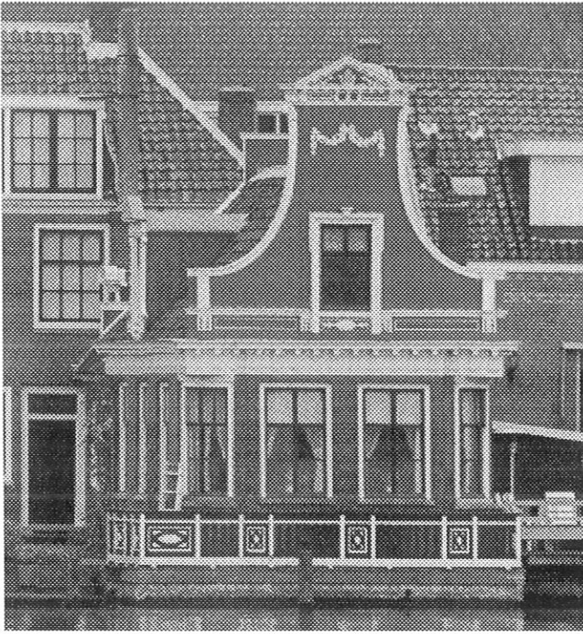
Luchthuis Lagedijk 80 (Honig Breethuis) te Zaandijk.